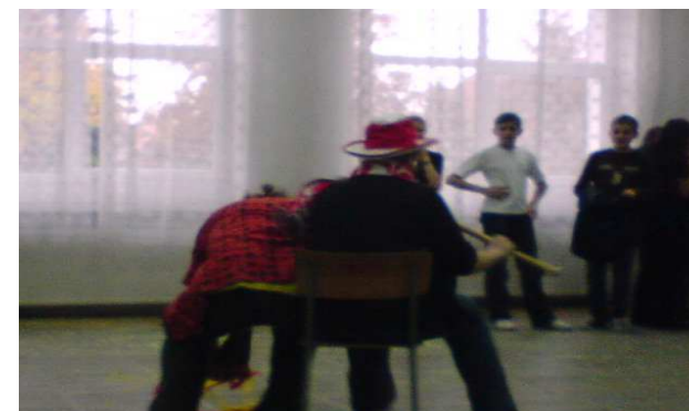
Decydujące starcie między wychowawcami klasy I b i 1c.